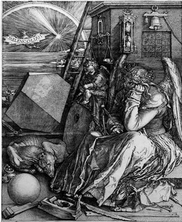
Die Melancholie – Albrecht Dürer